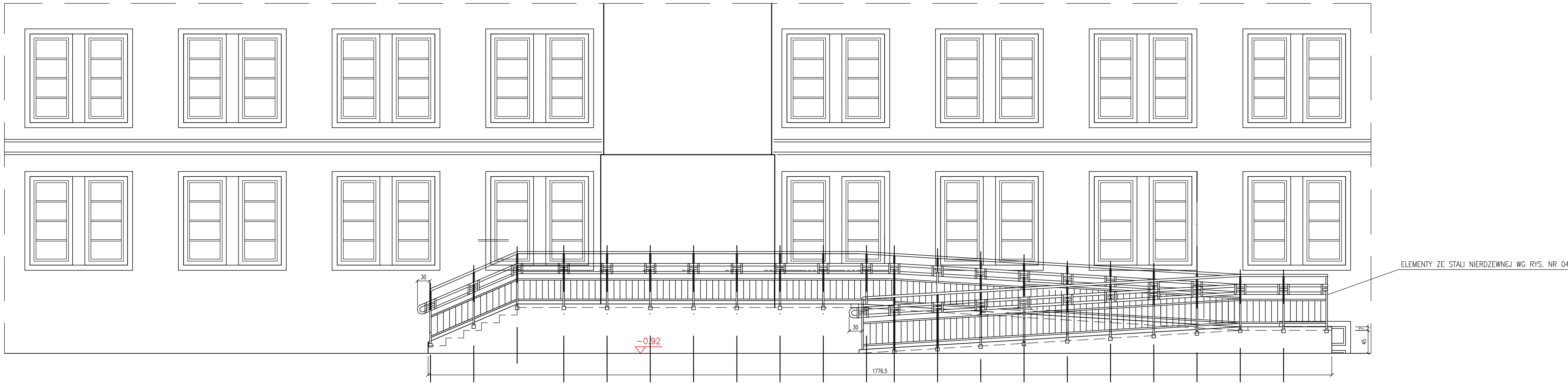
WIDOK ELEWACJI ZACHODNIEJ – FRAGMENT